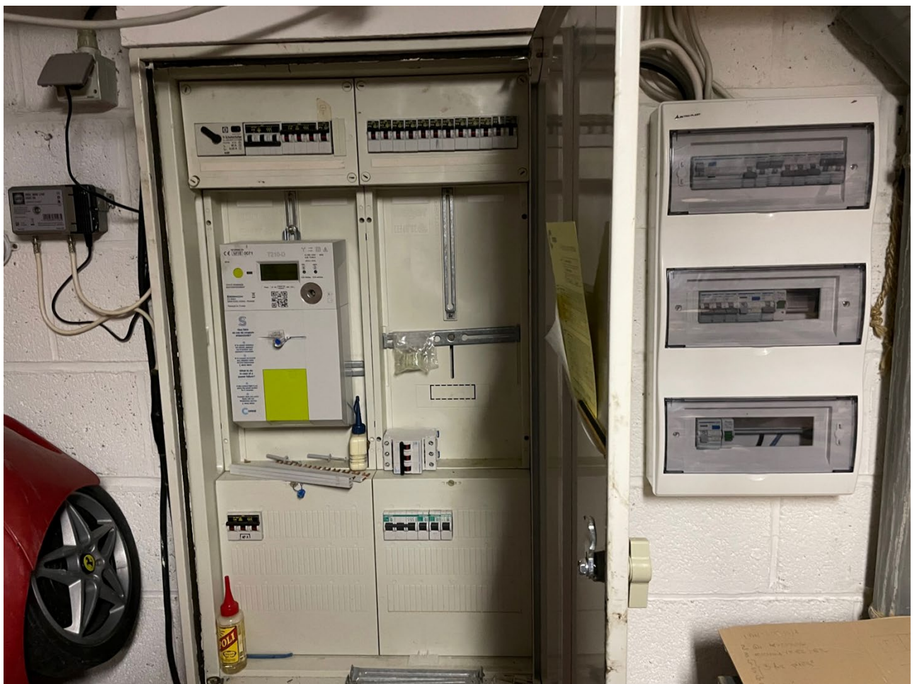
Tableau existant avec le compteur :

Consommation annuelle d'électricité 2022 (par heure) : voir fichier xls. A noter que la nouvelle voiture électrique va bientôt augmenter la consommation.